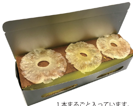
1本まるごと入っています。(上部にドライパイン3枚)