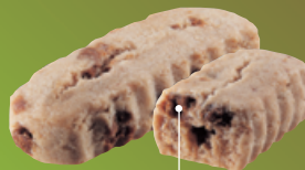
黒糖粒 ※イメージ画像