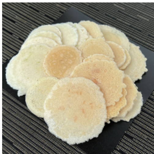
中身の小煎餅 サイズはランダム