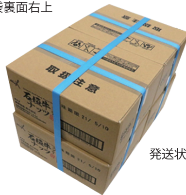
発送状態・12×4 ボール