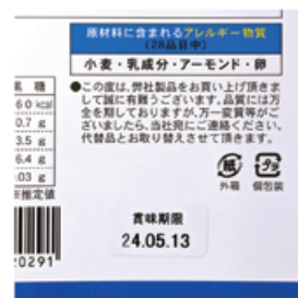
賞味期限：箱裏右下