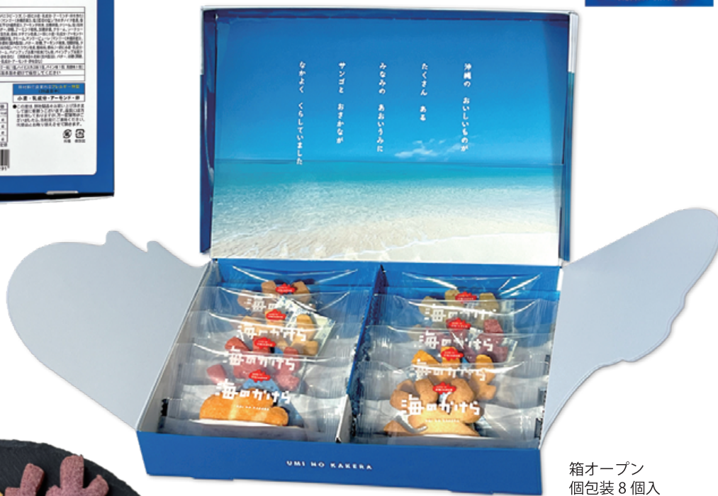
箱オープン 個包装 8 個入