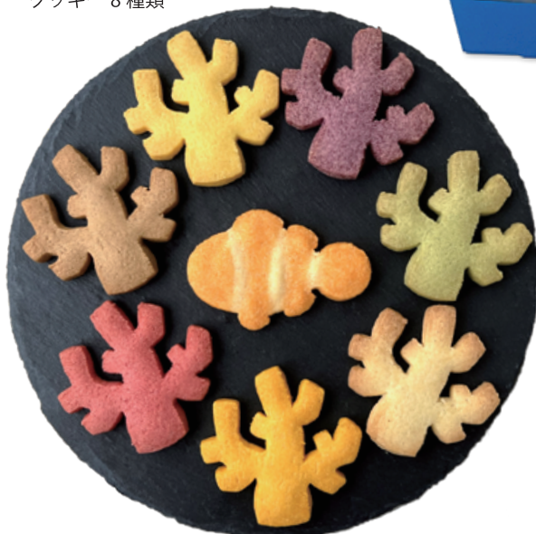
個包装開封 クッキー 8 種類